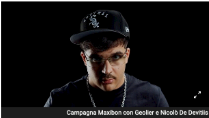
Campagna Maxibon con Geolier e Nicolò De Devitiis

Nicolò intraprende un viaggio nei luoghi in cui Geolier ha dato vita al suo grande successo e del suo «paradiso reale»